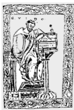
Scuola per Direttori di Coro Fondazione Guido d'Arezzo